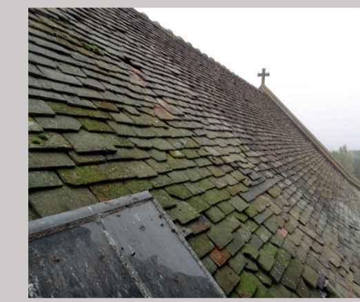
Chœur : versant sud