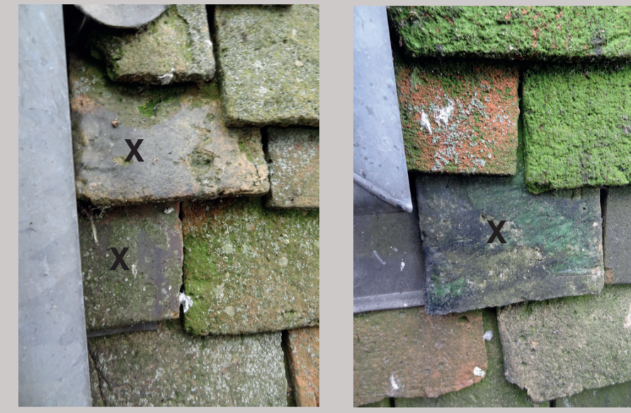
X = Tuiles glaçurées très probablement médiévales derrière le clocher

Notons que, derrière le clocher, quelques tuiles recouvertes d'une glaçure datent probablement du Moyen Âge.