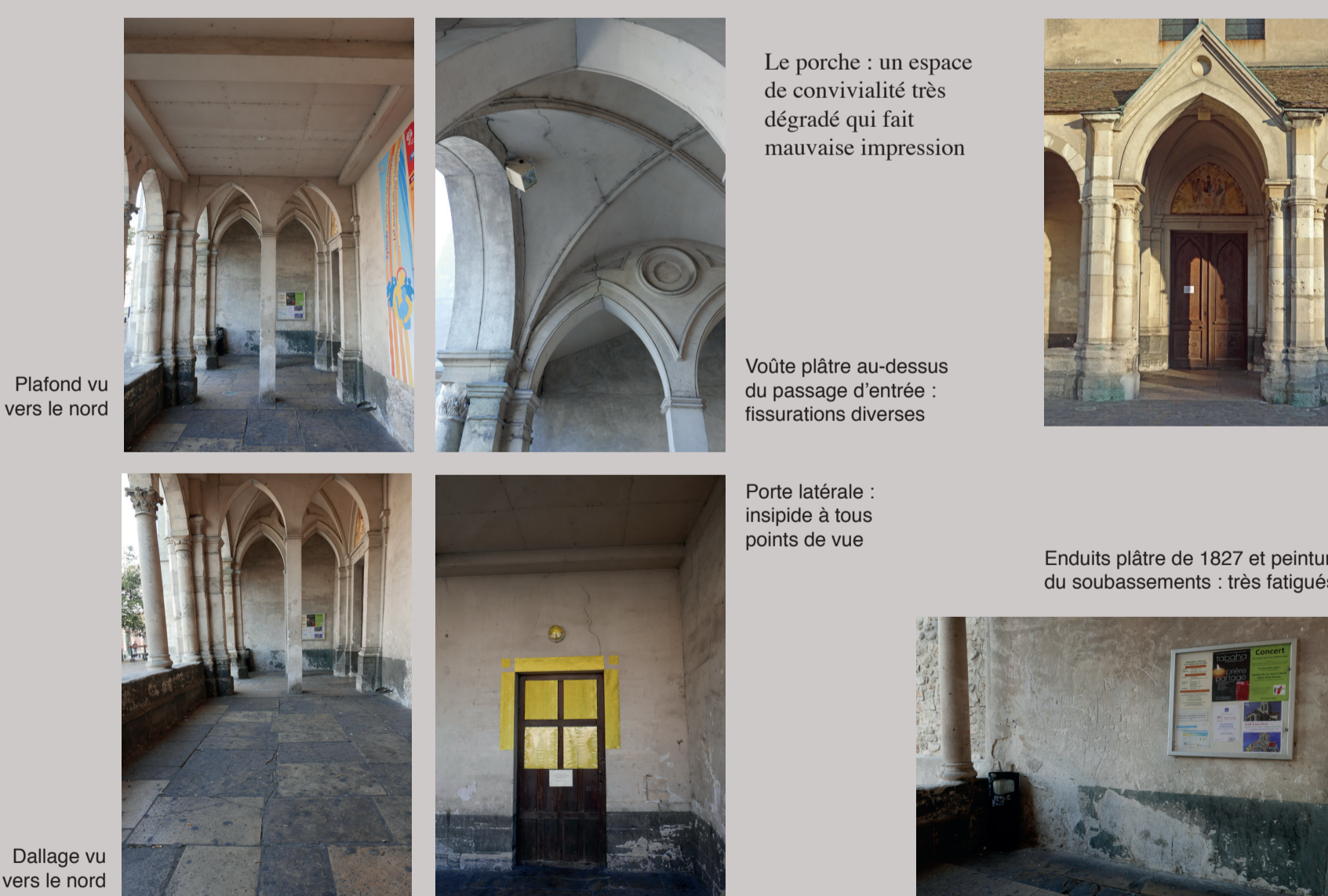
Plafond vu vers le nord

Le porche est très dégradé (dallage tâché, enduits fatigués) et nécessite un travail de remise en valeur.